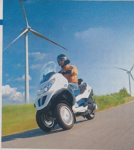
Öko-Roller. Der Piaggio MP3 Hybrid ist umweltfreundlich wie ein E-Roller und praktikabel wie ein Benziner.

Wie seine verschiedenen Varianten mit Verbrennungsmotoren hat auch das Hybrid-Modell die ebenso extravagante wie faszinierende Fahrgestelltechnik: Die beiden Vorderräder federn unabhängig voneinander ein und